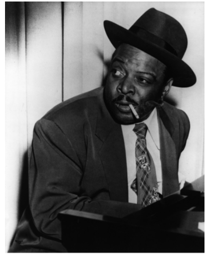
Count Basie from "Count Basie-Swingin' the Blues" (Masters of American Music)

szólisták, mint Ben Webster, Coleman Hawkins vagy épp Harry Sweets Edison. A hatvanas években megjelent egy Impulse album, mely a Kansas City 7 nevet kapta és ez a fuvolákkal is bővített kisegyüttes olyan siker lett, hogy több lemezt is megélt ezen a néven a csapat. A '70-es években a Pablo Recordsnál folytatta a menetet és mindvégig hű maradt saját stílusához.